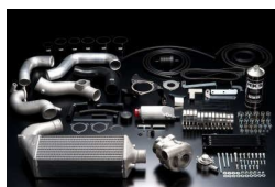
Система GT S/C