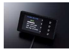
Flash Editor (только для выпущенных для японского внутреннего рынка авто)