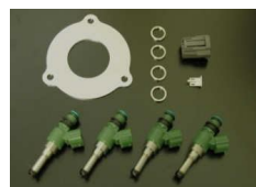
Комплект доработки топливной системы